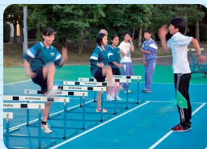
磐田スポーツ部活 指導