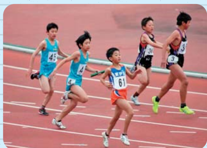
西部小学生陸上大会にて