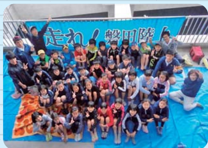
ジュニア強化参加メンバー