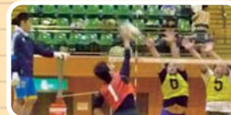
バレーボールを楽しんでいる風景写真