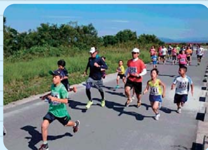
月例マラソン記録会