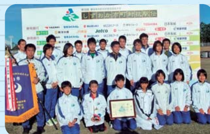
静岡県市町村対抗駅伝 磐田市チーム (第17回)