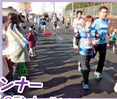
全国各地より9,701人のランナーが出走!