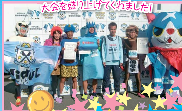
大会を盛り上げてくれました!