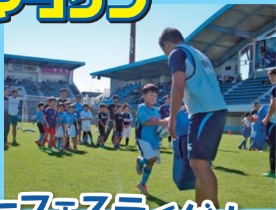
サッカー・ラグビーフェスティバル ジュビロ磐田、ヤマハ発動機の選手とのふれあい♪