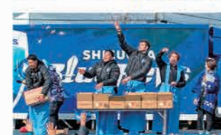
※ブルーレヴズでは昨シーズン、試合会場でも餅まきを行いました。今シーズンも年始のイベントを企画しています。