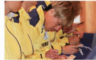
秋葉神社(浜松市天竜区)